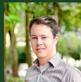
Diego Piai Finanças Corporativas in