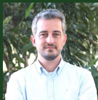
Eduardo Vian Finanças Corporativas in