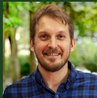
André Heller Times de Alto Rendimento in